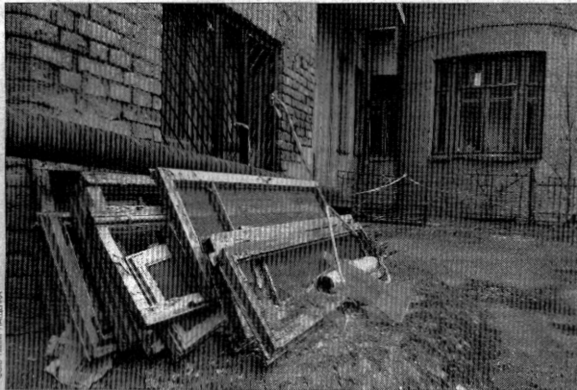
Будинок № 8 на Костьольній було споруджено на початку минулого сторіччя, тому він потребує серйозного ремонту

Мешканці постійно скаржилися на неможливість приватного проживання в будинку, тому що, з їхніх слів, він перетворився на публічний заклад — щодня гучна музика, гудіння автовок та інші незручності. "До